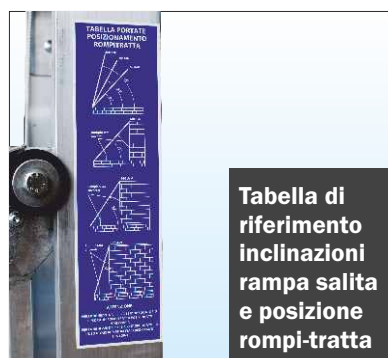
Tabella di riferimento inclinazioni rampa salita e posizione rompi-tratta

Sicurezza anti-caduta ad arresto automatico in caso di rottura fune