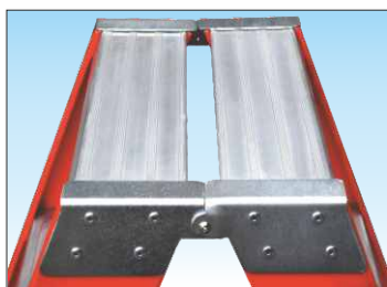
Cerniera in acciaio zincato con ripiano superiore dimensioni mm. 200 x 300