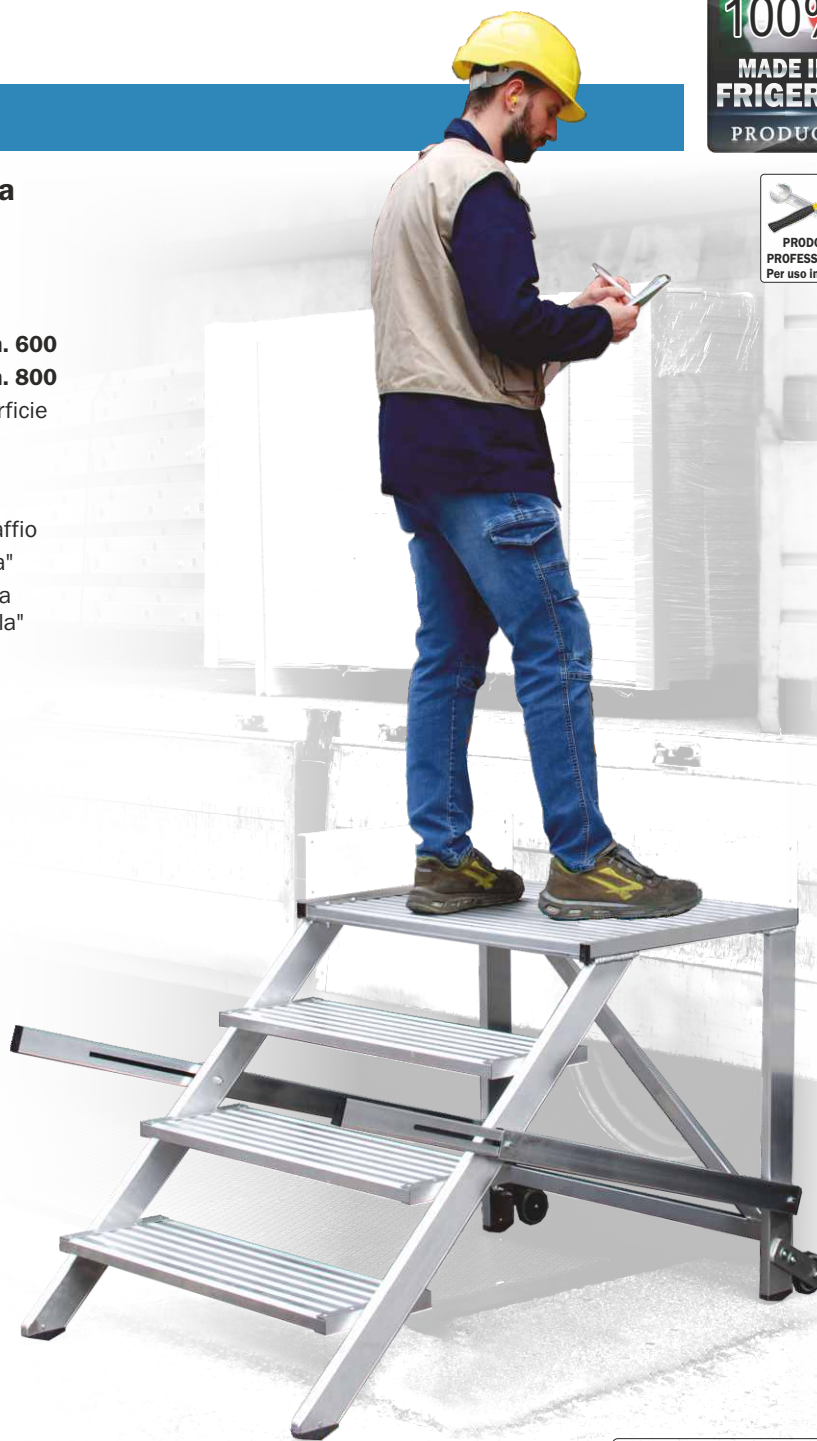
In foto articolo SCA 7080/04

Codice SCC PDAI Piastra di base singola € 27,00