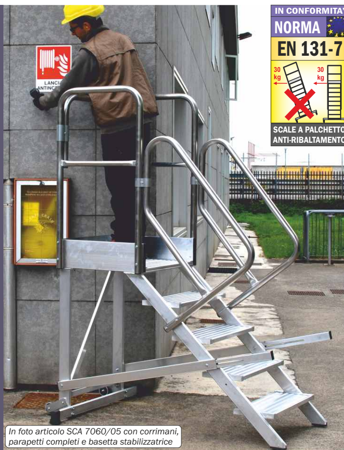
In foto articolo SCA 7060/05 con corrimani, parapetti completi e basetta stabilizzatrice