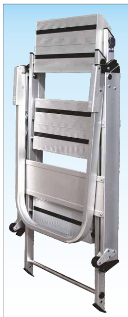
Minimo ingombro con gradini a scomparsa occupa poco spazio