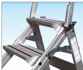
Barra distanziatrice ad apertura automatica e robusti gradini anti-scivolo profondi 20 cm.