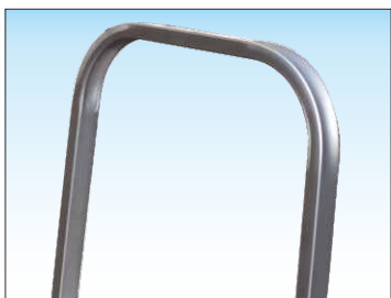
Parapetto d'alluminio ribaltabile alto 55 cm con maniglia di blocco e sblocco rapido