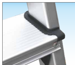
Gradino piano profondo mm. 80 con zigrinatura anti-scivolo