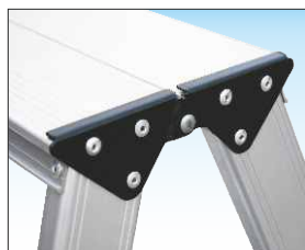
Ripiano terminale cm. 18 x 33 con cerniera in acciaio zincato