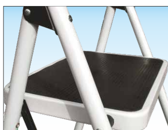
Ampi gradini con chiusura a scomparsa in acciaio verniciato ricoperti in gomma