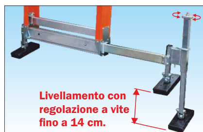
Basetta telescopica con chiusura a scomparsa e piedi basculanti che si adattano al terreno; dotata di n° 1 piede livellatore in acciaio zincato con regolazione a vite che può essere montato e smontato all'occorrenza per colmare pendenze o dislivelli con facilità e precisione