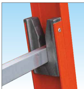
Spinotto d'innesto in alluminio indeformabile che garantisce la massima tenuta e la lunga affidabilità nel tempo