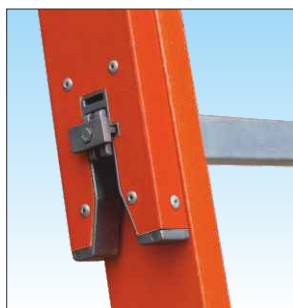
Anti-sfilo tronchi in alluminio ad attivazione manuale: garantisce un collegamento sicuro tra gli elementi scala

Una scala componibile capace di grande estensione che contiene l'ingombro per essere trasportata con facilità e leggerezza, è realizzata con profili montanti in vetroresina è idonea per uso con tensione elettrica non superiore a 1000V non sporca le mani, ed è particolarmente indicata per manutenzioni sulla rete telefonica.