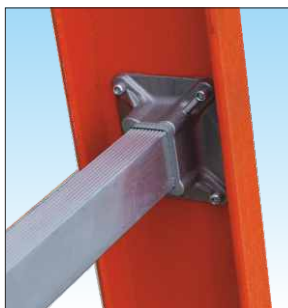
Piolo anti-scivolo in alluminio dimensioni 35 x 20 mm.