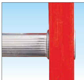
Attacco piolo-montante a doppia bordatura, interna ed esterna