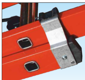
Cerniere di sfilo tronchi in robusto profilato di alluminio anti-ruggine