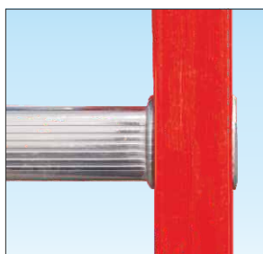
Attacco piolo-montante a doppia bordatura, interna ed esterna