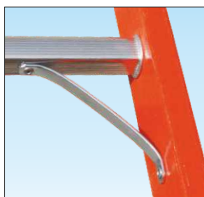
Estremità rinforzate con nervature anti-urto in acciaio zincato