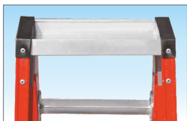
Robusta vaschetta porta-oggetti in alluminio dimensioni cm. 9 x 30 e profonda 4 cm.