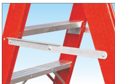
Barre distanziatrici di sicurezza anti-chiusura e anti-divaricamento ad apertura automatica in alluminio anti-ruggine