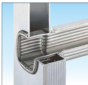
Piolo mm. 30 x 30 fissato con bordatura interna ed esterna