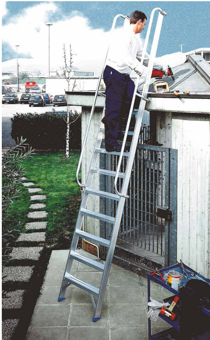
In foto articolo SCA 6078N/11

N.B. Gli articoli SCA 6078N fino alla misura 11 non dispongono della basetta stabilizzatrice perché non richiesto dalla EN 131.