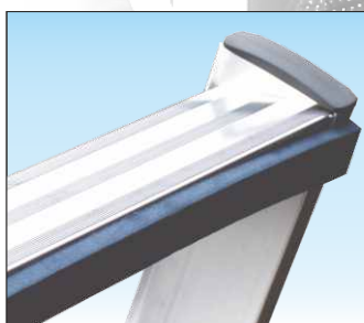
Appoggio su superfici pregiate

Con nervature di rinforzo in alluminio anti-ruggine saldate contro gli urti laterali e dotata di piedini ad innesto che evitano il distacco accidentale