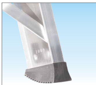
Base rinforzata con nervature anti-urto e piedini ad innesto anti-distacco

Unito al montante verticale mediante robusta saldatura ad angolo nascosta alla vista a garanzia della massima stabilità e di lunga affidabilità nel tempo