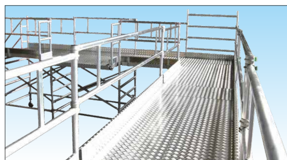
Passerella con superficie in lamiera mandorlata di alluminio

Su richiesta: Superficie passerella e fermapiedi in lamiera di alluminio mandorlato