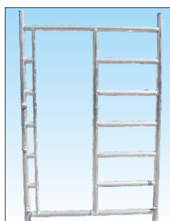
Montante di passaggio