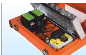
Batteria ultra-compatta al GEL - 33 Ah 12V DC