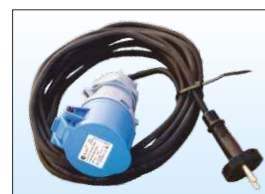
Cavo di alimentazione e ricarica industriale