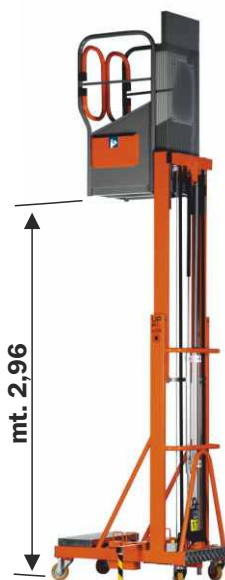
PA UPLIFT5S PA UPLIFT5SP