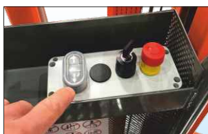
Quadro comandi e pulsantiera sul cestello