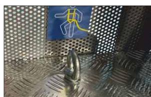
Punto di ancoraggio per D.P.I. anti-caduta sul cestello