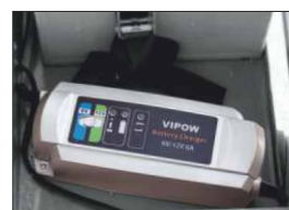
Caricatore batteria al GEL

Zavorramento con blocchi di carico da 15 kg. in acciaio verniciato a posizionamento rapido