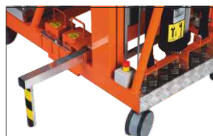
Stabilizzatori laterali estraibili