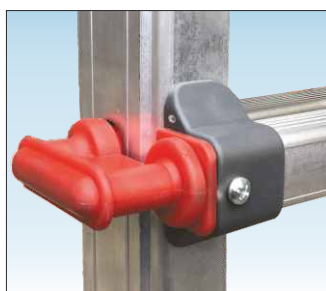
Regolazione altezza piano mediante ganci in acciaio rivestiti in nylon

Piattaforma maggiorata ! con larghezza di 55 cm.