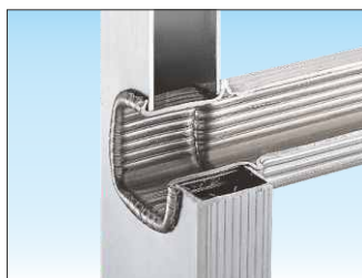
Attacco piolo-montante con doppia bordatura interna ed esterna