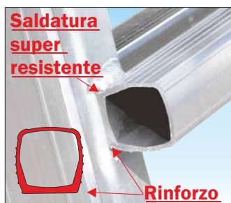
Gradini esterni in profilo dedicato con spessore maggiorato per una saldatura super resistente