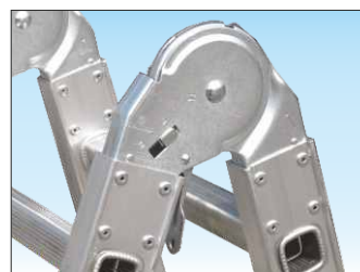
Cerniere in acciaio ad arresto automatico e sblocco rapido