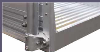
Finitura terminale verticale realizzata in lamiera di alluminio per nascondere l'apertura sottostante alla piattaforma