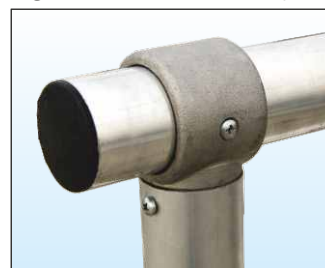
Parapetto realizzato in tubo Ø 50 mm con giunzioni in fusione di alluminio anti-ruggine fisse o snodabili per consentire cambi di direzione e di quota.