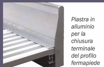
Piastra in alluminio per la chiusura terminale del profilo fermapiEDE