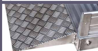
Finitura terminale inclinata a 15° realizzata in lamiera mandorlata di alluminio consente il transito su ruota