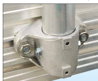
Telai di protezione ad installazione rapida mediante supporti in fusione d'alluminio a posizione regolabile durante la messa in opera.