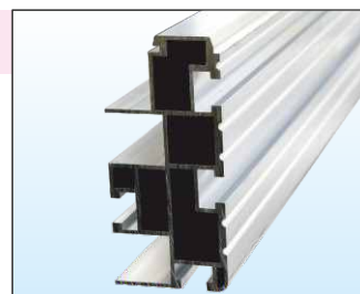
Profilo montante ad alta resistenza auto-portante fino a 6 mt provvisto di tracce guida, permette la massima regolazione durante la messa in opera.