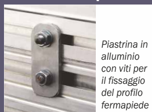
Piastrina in alluminio con viti per il fissaggio del profilo fermapiEDE