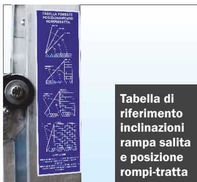
Tabella di riferimento inclinazioni rampa salita e posizione rompi-tratta

Sicurezza anti-caduta ad arresto automatico in caso di rottura fune