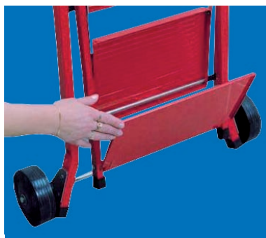
Ripiano carrello apribile manualmente in un semplice gesto