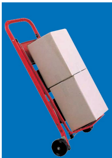
Trasformabile in carrello trasportatore

NORMATIVE EUROPEE EN 14183 NORMATIVE ITALIANE DL. 81