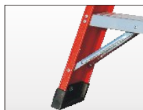
Piedino in materiale sintetico anti-scivolo