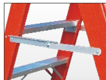
Barre distanziatrici automatiche in alluminio