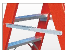
Barra anti-apertura in alluminio