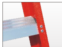
Gradino in alluminio profondo mm. 90