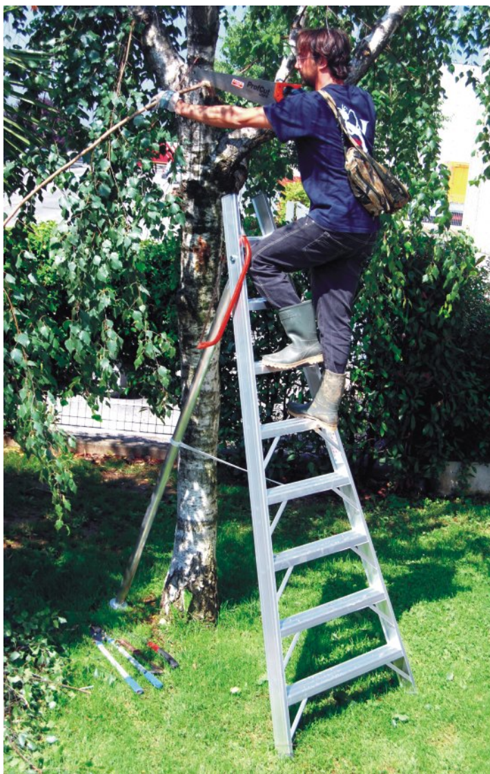
In foto scala con 1969 S/8 con punta tagliata

La scala può essere fornita con terminale a punta, utile per incastrare la scala fra i rami di una pianta oppure con punta tagliata che risolve l'ingombro nel trasporto e funge da comodo sostegno per attrezzi da taglio.